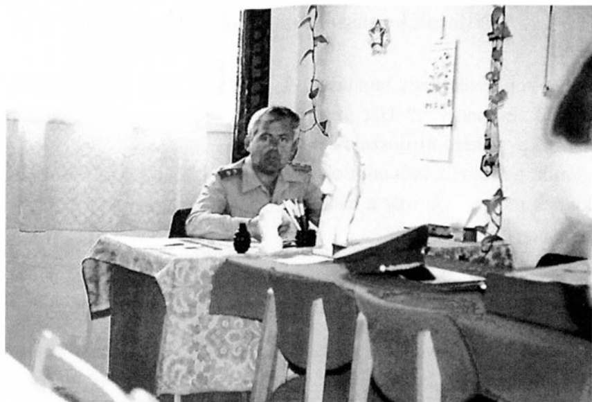
2. HKZ. PK. Politikai helyetteseként