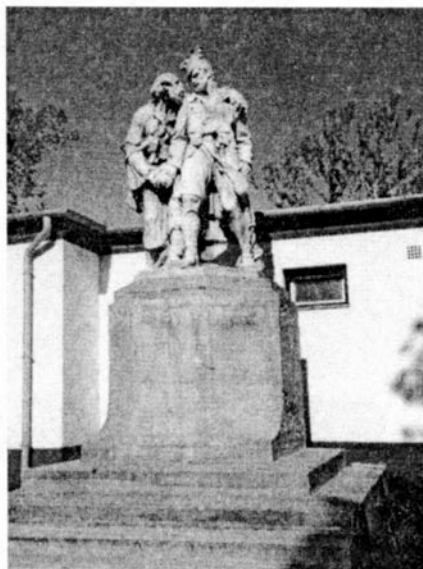
Ünnepi műsor, koszorúzás Hősök szobra