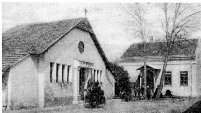
A bizottság megalakulásának helye (Nagyatád-Zárda)