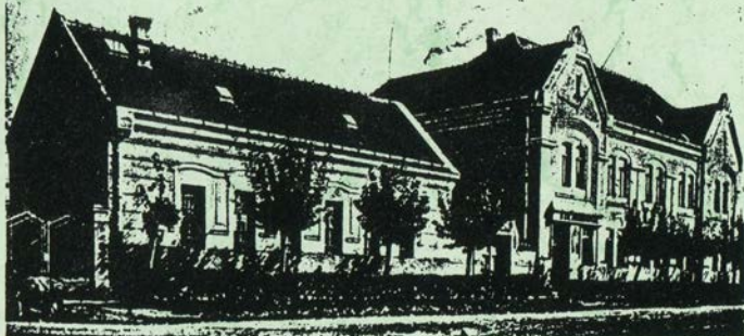
Korona szálló a mozival.